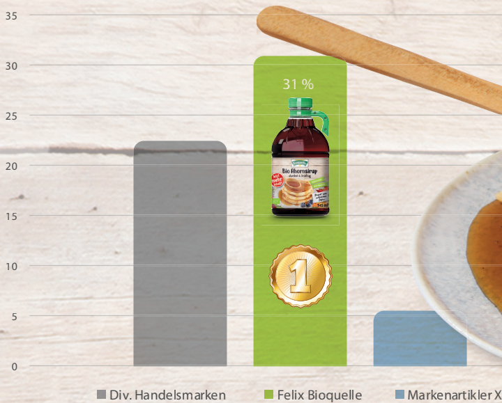
Marktanteile Wert Süßstoffe 2022 – Gastro*